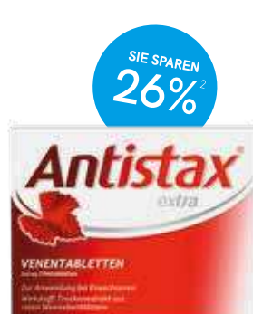
Antistax® extra Venentabletten - 90 Stück