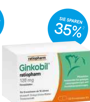
Ginkobil-ratiopharm® 120mg Filmtabletten - 120 Stück