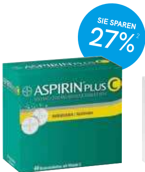
Aspirin plus C* Brausetabletten - 40 Stück