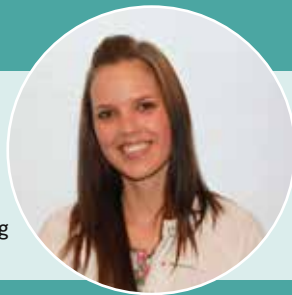
Ihre Stephanie König

Das medizinische Fachpersonal kann geeignete Empfehlungen zur Linderung der Beschwerden geben – beispielsweise Arzneimittel mit dem natürlichen Wirkstoff Pfefferminzöl. Pfefferminzöl beruhigt studienbasiert den Darm, indem die globale Symptomatik des gereizten Darms verbessert wird 1 . Zudem lindert er nachweislich Bauchschmerzen 2 und -krämpfe 3 und reduziert die lästigen Blähungen 2 . Das sieht auch die Leitlinie zu Reizdarm so: Sie empfiehlt den Wirkstoff – als einzigen pflanzlichen – mit dem höchsten Empfehlungsgrad A! 4